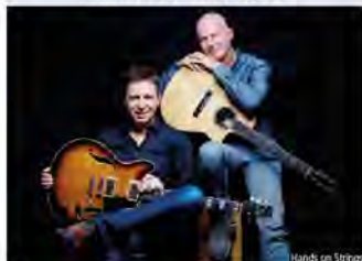
Hands on Strings

Bürgerhaus Eching Roßbergerstr. 6, 85386 Eching Tel. 089 / 37 97 92 62 buergerhaus@eching.de www.buergerhaus-eching.de VVK: Bürgerhaus Eching PaLoTi, Bahnhofstr. 4b, Eching www.muenchenticket.de