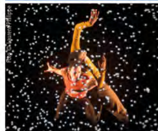
Compagnie Käfig 27./28.6. Fürstenfeldbruck Städte von A-Z S. 40