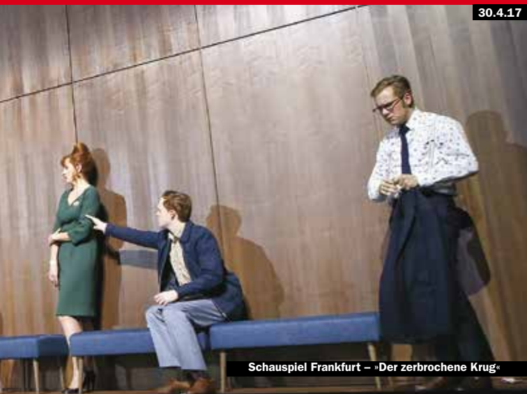
Schauspiel Frankfurt – »Der zerbrochene Krug«